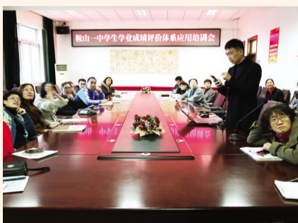
2018年10月31日,校信息中心与课程教学科联合组织开展网络阅卷与学业成绩评价培训会,推进精准教学与提分补差。