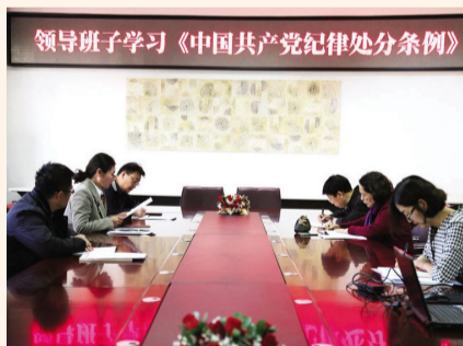
2018年10月12日,校领导班子学习《中国共产党纪律处分条例》。

高端,一次现代之旅。精心的选题,用心的准备,走心的画面,入心的交流,刘老师的讲座让与会师生身临其境,沉醉其中,聆听一个精彩的讲座就是一次和智者的对话。 一所名校最重要的是其文化内涵,相信“一中大讲堂”系列讲座活动一定会成为一中校园文化的重要一环。 (课程教学科 李强胜)