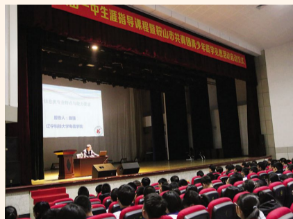
2018年10月12日,校团委联合团市委、市团校为21届学生开展生涯规划系列指导课程。