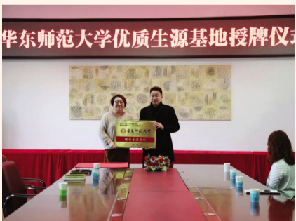
2018年10月31日,华东师范大学授予我校优质生源基地称号。