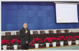
关注教学细节 养成反思习惯