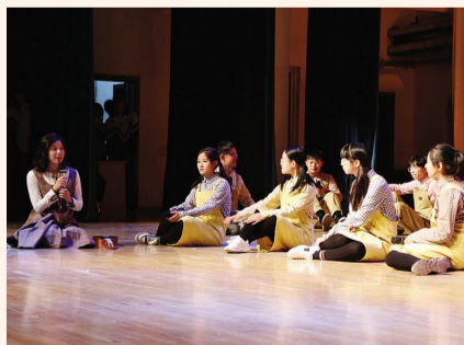
2018年10月24日,我校英语组联合校学生会和社团举办英语节活动。