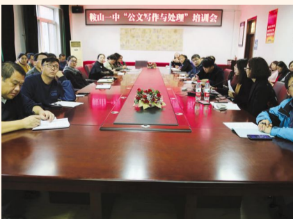
2018年10月24日,学校组织管理部门人员开展公文写作培训,提高学校管理品质。