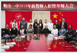
雨润风暖 新荷初绽