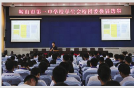
鞍山一中第三十届校团委学生会换届选举顺利举行