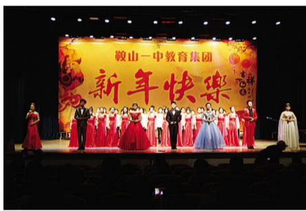
鞍山一中2017年高一年级(19届)元旦联欢会现场-1