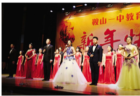
鞍山一中2017年高二年级(18届)元旦联欢会现场-1