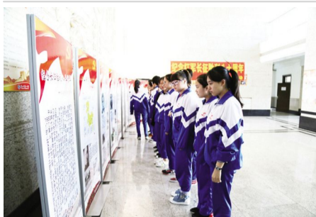
2016年9月30日,鞍山一中和市烈士陵园联合举办“纪念红军长征胜利80周年”图片展,组织学生观看,追忆艰苦岁月,继承先辈遗志。