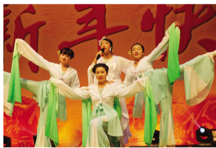
鞍山一中2017年高一年级(19届)元旦联欢会现场-2