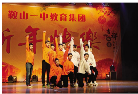
鞍山一中2017年高二年级(18届)元旦联欢会现场-2