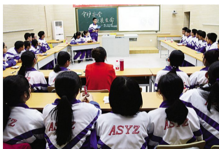
2016年12月1日,高二年级1817班召开《守护安全敬畏生命》典型班会。