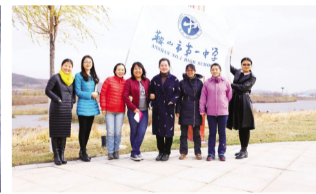
2017年11月10日中午,为丰富我校教职工的校园文化生活,提高教职员工的身体素质,学校工会组织教工万水湖边健身竞走活动。在紧张的上课批改的繁忙节奏中,湖边走一走,撒一路欢笑,洗去一身疲惫,为明天的敬业奉献充好电!