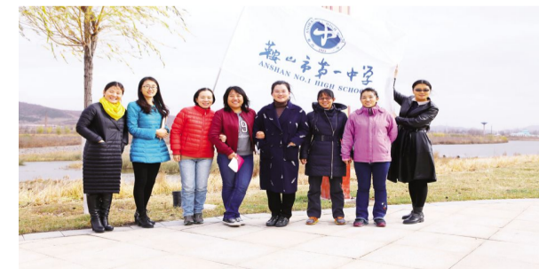
2017年11月10日中午,为丰富我校教职工的校园文化生活,提高教职工的身体素质,学校工会组织教工万水湖边健身竞走活动。在紧张的上课批改的繁忙节奏中,湖边走一走,撒一路欢笑,洗去一身疲惫,为明天的敬业奉献充好电!