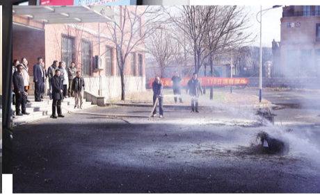
2017年11月9日,学校举行“119消防灭火演练活动”,全体教工现场学习和操作灭火器和消防水枪举行灭火演练。