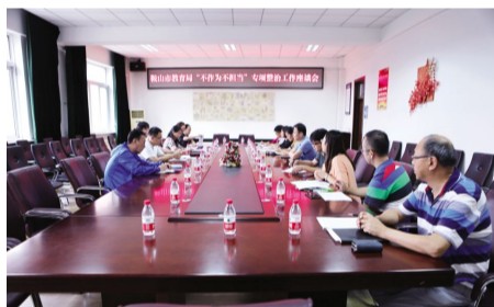
2017年9月15日,市营商办领导到校召开“不作为不担当”座谈会,共商教育工作与发展,为鞍山创建优越的营商投资环境共同努力做出新贡献。