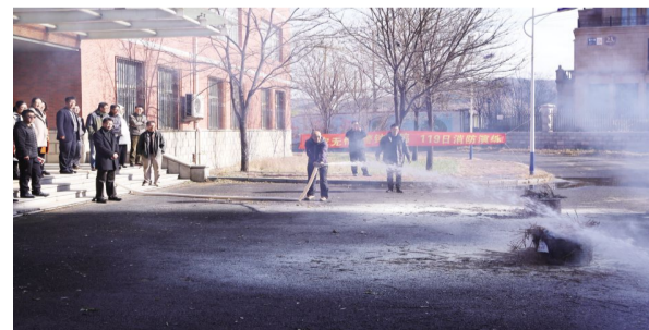
2017年11月9日,学校举行“119消防灭火演练活动”,全体教工现场学习和操作灭火器和消防水枪举行灭火演练。