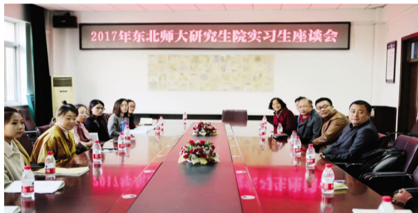
2017年9月13日,东北师范大学研究生院和市教育局领导来校召开研究生实习座谈会,共同交流教育教学实习工作和探讨师生共同培养发展问题。