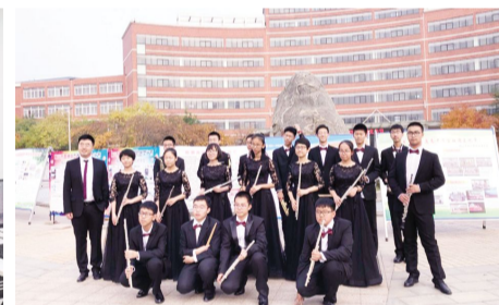
2017年9月29日,鞍山市首届高中学生社团文化节在我校举行。我校学生社团在文化节展示活动中获得一致赞誉。