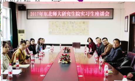
2017年9月13日,东北师范大学研究生院和市教育界领导来校召开研究生实习座谈会,共同交流教育教学实习工作和探讨师范生共同培养发展问题。