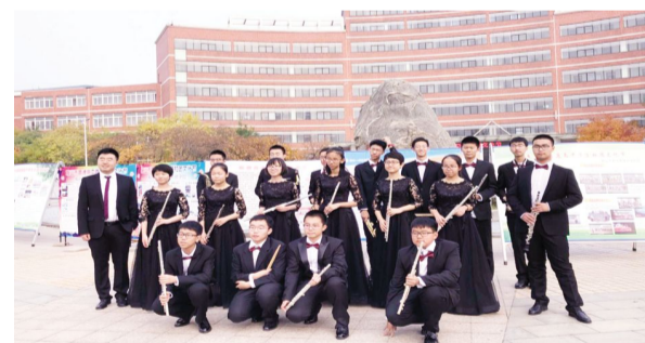
2017年9月29日,鞍山市首届高中生社团文化节在我校举行。我校学生社团在文化节展示活动中获得一致赞誉。