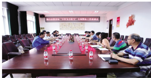
2017年9月15日,市营商办领导到校召开“不作为不担当”座谈会,共商教育工作与发展,为鞍山创建优越的营商环境共同努力做出新贡献。