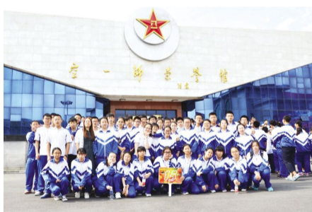
2017年6月2日,我校高一学生到驻鞍空军某部参观荣誉馆。