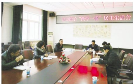
校领导班子“两学一做”民主生活会

(1)学校党政领导全面负责“文明学校”建设,把创建文明学校工作列入学校“十三五”发展规划和年度工作计划。成立创建文明校园工作领导小组,负责文明校园建设的