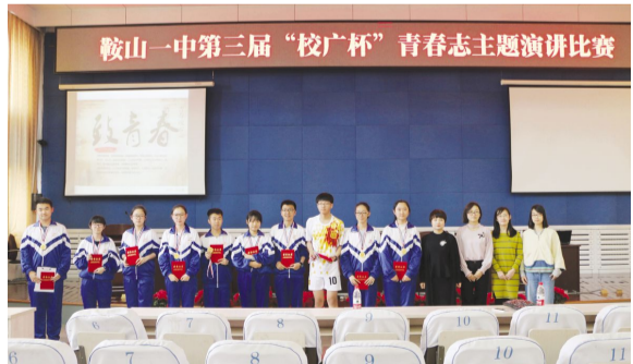
鞍山一中第三届“校广杯”青春志演讲大赛

(5)学校领导班子加强与市教育局党委、市教育局、市创城办及各媒体的联系与沟通,及时主动地反映创建工作中存在的问题,积极争取支持与配合,加强宣传和舆论监督。