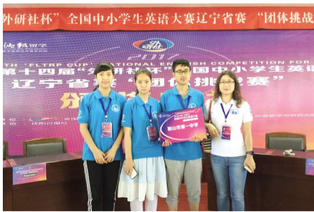
2017年6月10日,我校学生参加第十四届“外研社杯”英语辩论赛获得省三等奖。