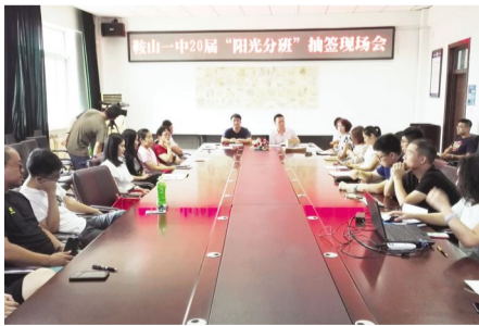
2017年8月11日,我校组织“鞍山一中20届学生阳光分班抽签现场会”。