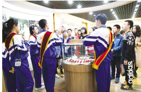
学生参观校史展览室追溯学校发展峥嵘岁月

(1)通过宣传教育(特别是新生入学教育),使广大师生牢记我校的校风“勤奋 和谐 求实 创新”,教风“尚德乐业 博学善教”,学风“慎思笃行 立志成才”,校训“礼健智诚”、学校精神“追求卓越”和“以学生发展为本,为学生可持续发展和终身幸福奠定基础”的办学理念,参观校史