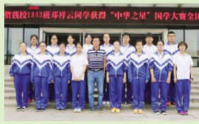
全国作文大赛决赛结束十九学子再创佳绩