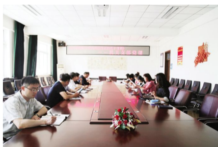
2017年5月18日,机关党支部组织党课学习《关于新形势下党内政治生活的若干准则》。