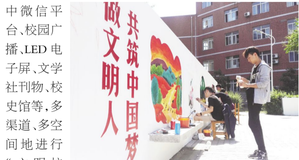
创城公益广告绘制

(3)充分利用《鞍山一中报》、鞍山一中网站、鞍山一中微信平台、校园广播、LED 电子屏、文学社刊物、校史馆等,多渠道、多空间地进行“文明校