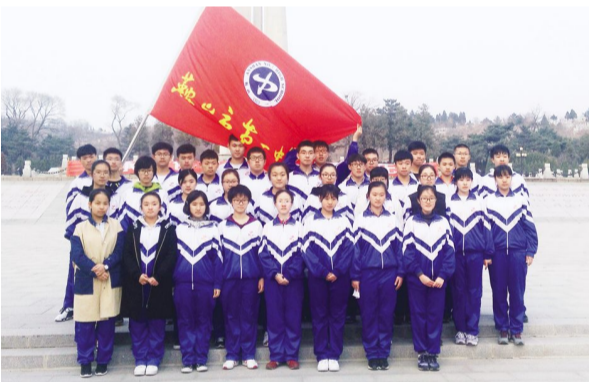
清明节学生到烈士陵园扫墓祭奠革命先烈

(6)心理健康教育中心通过开设心理健康教育课、编写心理健康短剧、心理健康集体活动、建立学生心理档案、开