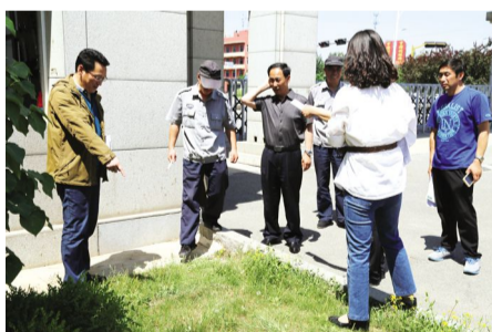
2017年5月31日,我校开展“清新校园,从我做起”为主题的世界无烟日活动,清理检查校园内控烟情况。