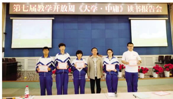
语文组组织《大学·中庸》读书报告会

(4)加强团支部和学生会的建设与管理,让学生参与学校管理,在创建文明校园过程中发挥积极作用。利用优秀社团,如机器人社团、推理社、国防教育社团等全面推进我校社团建设工作,打造鞍山一中特色社团活动。利用清明节、五四青年节、端午节、十一国庆节、十二月五日国际志愿者日等,组织开展宣誓签字、文艺汇演、歌咏比赛、志愿服务等活动,让学生通过亲身参与、体验,践行社会主义核心价值观。