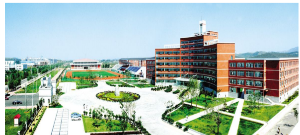
美丽宁静的鞍山一中校园

(5)开展“文明班级”、“文明宿舍”、“优秀学生、优秀团员”的评选活动,通过树立先进典型,打造文明校园的良好环境。