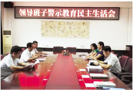
2017年7月14日,校领导班子召开警示教育民主生活会。