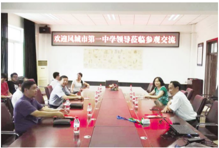
2017年7月26日,凤城一中领导来校参观交流智慧校园建设应用工作。