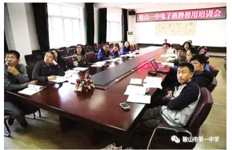
2017 年 4 月 26 日,我校组织校领导和部门管理人员举行“智慧校园平台”管理与应用培训。