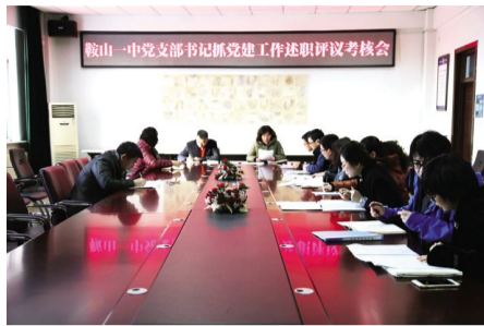
2017 年 1 月 13 日,校党委召开党支部书记抓党建工作述职评议考核会。