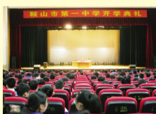
忆往昔峥嵘岁月 展未来辉煌明天