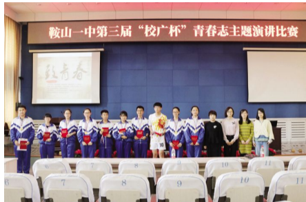
2017 年 4 月 26 日,语文组组织“校广杯”青春志演讲比赛。