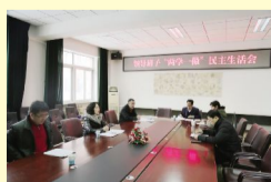
校党委召开“两学一做”民主生活会