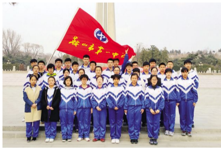
2017 年 3 月 30 日,校团委组织学生烈士陵园扫墓,传承红色记忆祭奠革命先烈。