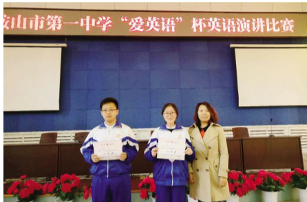
2017 年 4 月 27 日,英语组组织“爱英语”杯英语演讲比赛。