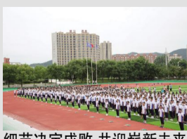
细节决定成败 共迎崭新未来