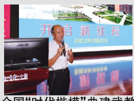
全国“时代楷模”曲建武教授到我校作专题报告