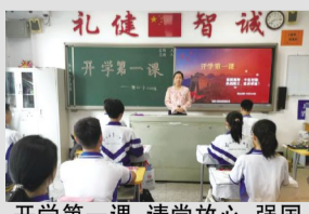
开学第一课:请党放心,强国有我!