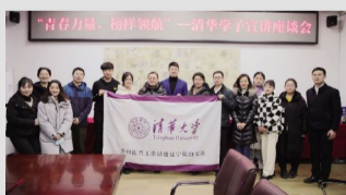
青春力量 榜样领航