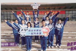
共赴冰雪之约 共享冰雪盛宴