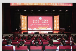
风华正茂 梦想启航